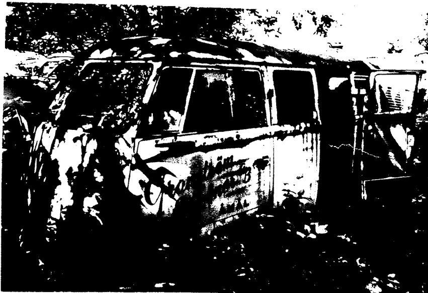
VW - 1954 KLEINBUSS