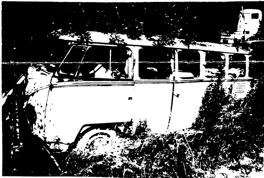
VW LYXBUSS - 56 UTAN TAKFÖNSTER O SOLTAK